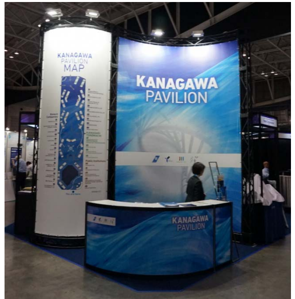
昨年のパビリオンの様子